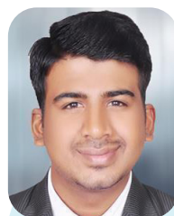
Prakash N Enterprise Context and Global Summary Analyst